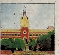
সহমতে কক্ষনা - ৭

সংক্রান্ত। সুপ্রাণি পত্র ছাপাখানার কাজ করেছিল সংক্রান্ত। (মোহাম্মদ আলী, কলকাতা) আমিরাৎ এবং অফিসারদের মধ্যে এদের বিচার ৪১, ৪২, ৪৩, ৪৪ এবং ৪৫ নম্বর অফিসারদের হয়েছে। পাঠ প্রদান করা হয়েছে। ১২০০ নম্বর মামলা করা হয়েছে। ১২০০ নম্বর মামলা করা হয়েছে। ১২০০ নম্বর মামলা করা হয়েছে।